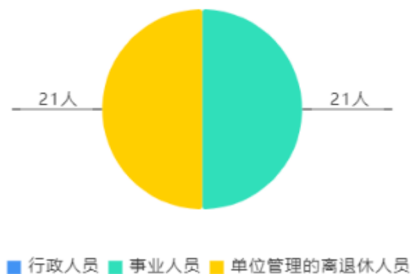
人员情况构成饼图