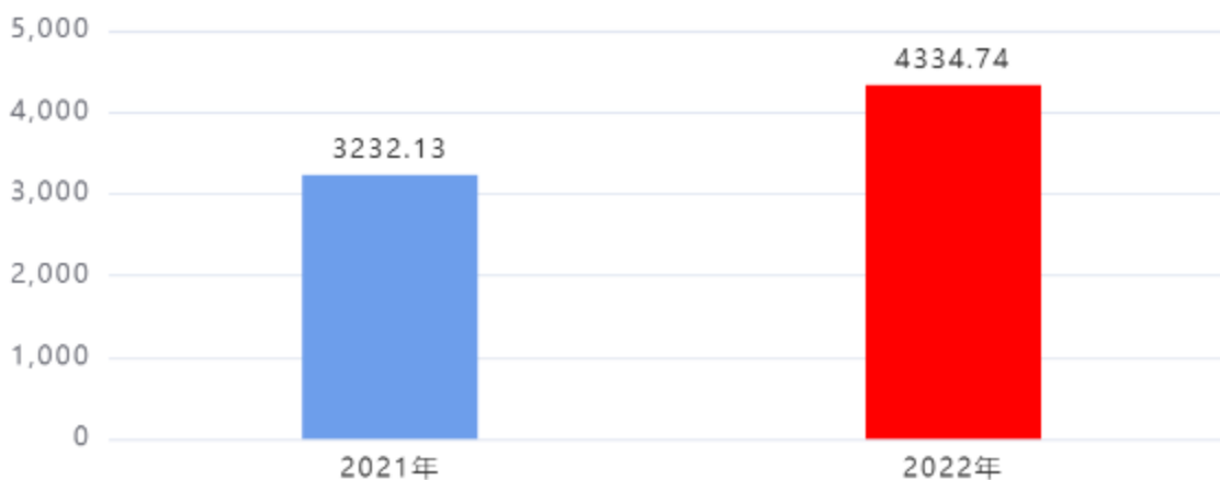
收入、支出决算总计对比图（单位：万元）

2022年度收入总计、支出总计均为4,334.74万元，与上年相比收入总计、支出总计均增加1,102.61万元，增长34.11%，增长的主要原因是：辖区内新成立社区较多，导致经费增加。