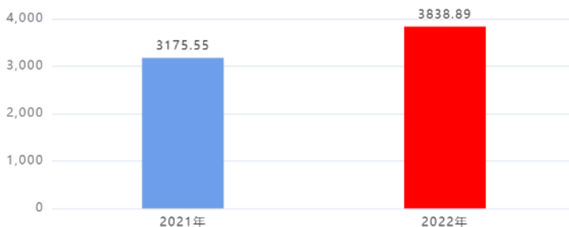
财政拨款支出对比图（单位：万元）