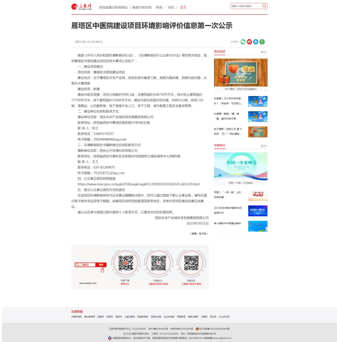
附图 1：首次信息公示截图