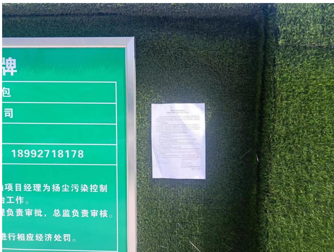
附图 4：征求意见稿张贴公示照片